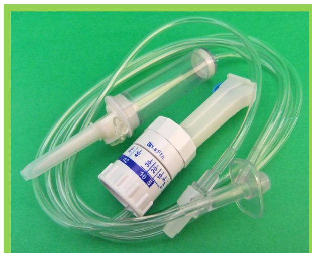
DISPOSITIVO MEDICO MONOUSO - STERILE - APIROGENO